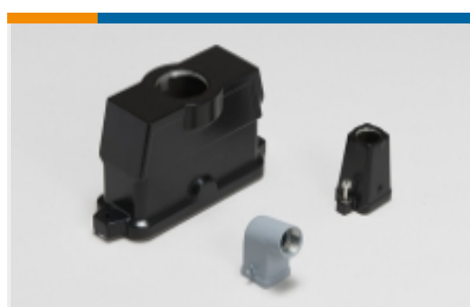
矩形连接器防护罩(1219)