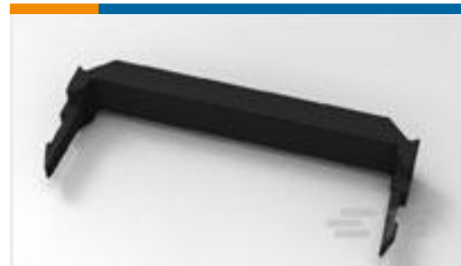
TE 零件编号499252-4 050 STRAIN RELIEF A-L RCPT