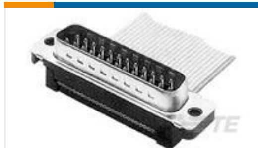
TE 零件编号1658608-2 25 POS HDF PLUG, MS, LEAD FREE