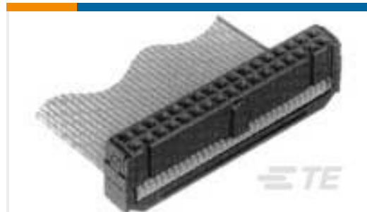
TE 零件编号1-1658622-0 50 NOVO MIL/CTR 30DP, LEAD FREE